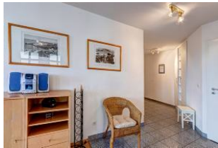
Blick in den Eingangsflur