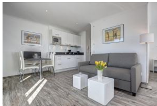
Essplatz und Küchenzeile