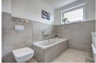
Bad mit Wanne