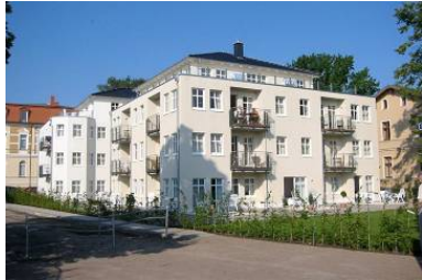
Architekturansicht "Villa Aquamarina" von der Promenade