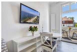
Essbereich mit Blick zum Balkon