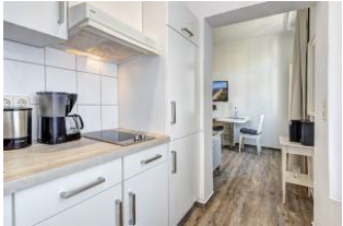
Blick aus der offenen Küche zum Essbereich