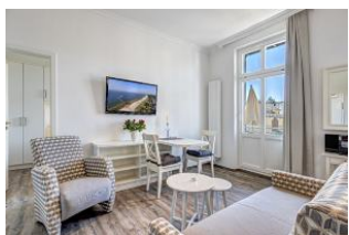
Blick in den Wohnraum

Wir bauen diese Wohnung bis Ostern 2021 für Sie um! Es entsteht direkt an der Strandpromenade - 1. Reihe mit SÜDBALKON - ein schönes 2 - Zimmer - Apartment im I. OG mit moderner Einrichtung, separater Küchennische, Duschbad, Südbalkon mit Sonne bis abends. Die Wohnung verfügt über einen Pkw-Stellplatz. In der Garage können Fahrräder und ähnliches untergestellt werden. Im Haus gibt es eine Sauna. Von der "Villa Germania" aus können Sie das Ortszentrum und die bekannte Ahlbecker Seebrücke in ca. 3 Minuten zu Fuß erreichen. Zum Strand sind es 50 m. Von Mai bis September ist ein Strandkorb im Tagespreis enthalten. Der Grundriss ist der der renovierten Wohnung. Die Bilder sind noch die der unrenovierten Wohnung und werden durch neue Fotos ersetzt, sobald diese vorliegen.