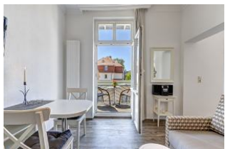
Wohnbereich mit Blick zum Balkon