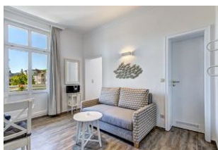
Couch im Wohnraum