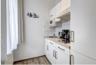
Blick in die Küche