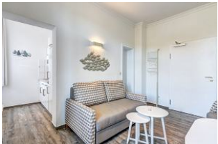
Wohnzimmer mit Blick ins Schlafzimmer