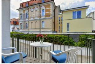
Balkon nach Süden