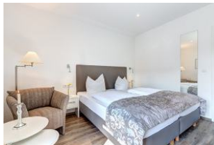
Sehr komfortables Doppelbett