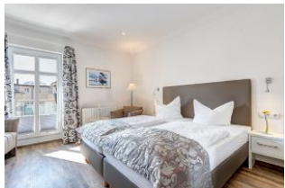
Schlafbereich und Sitzgelegenheit, Zugang zur Dachterrasse

1. Reihe an der Strandpromenade mit DACHTERRASSE und FAHRSTUHL im Haus! Chices 1-Zimmer-Apartment mit moderner guter Ausstattung. Kombiniertes Wohn-/Schlafraum, separate Küche mit Essplatz, Duschbad, Dachterrasse nach Süden mit Sonne bis abends. Die Wohnung verfügt über einen Pkw-Stellplatz. In der Garage können auch Fahrräder und ähnliches untergestellt werden. In unserer "Villa Germania" nebenan gibt es eine Sauna. Von der "Villa Aquamarina" sind es zum Ortszentrum und der Seebrücke ca. 3 Minuten zu Fuß. Zum Strand sind es 50 m.